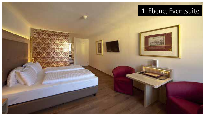
Nutzung als 2 Einzelzimmer: Event-Suite

Die wunderschön neu renovierten Doppelzimmer sind ca. 30 m 2 groß und bieten mit den modern gestalteten Badezimmern jeglichen Luxus. Sie verfügen über ein großzügiges Schlafzimmer mit Flachbild-TV-Gerät und ein Badezimmer mit Dusche und separatem WC. Kostenloses W-Lan im ganzen Haus!